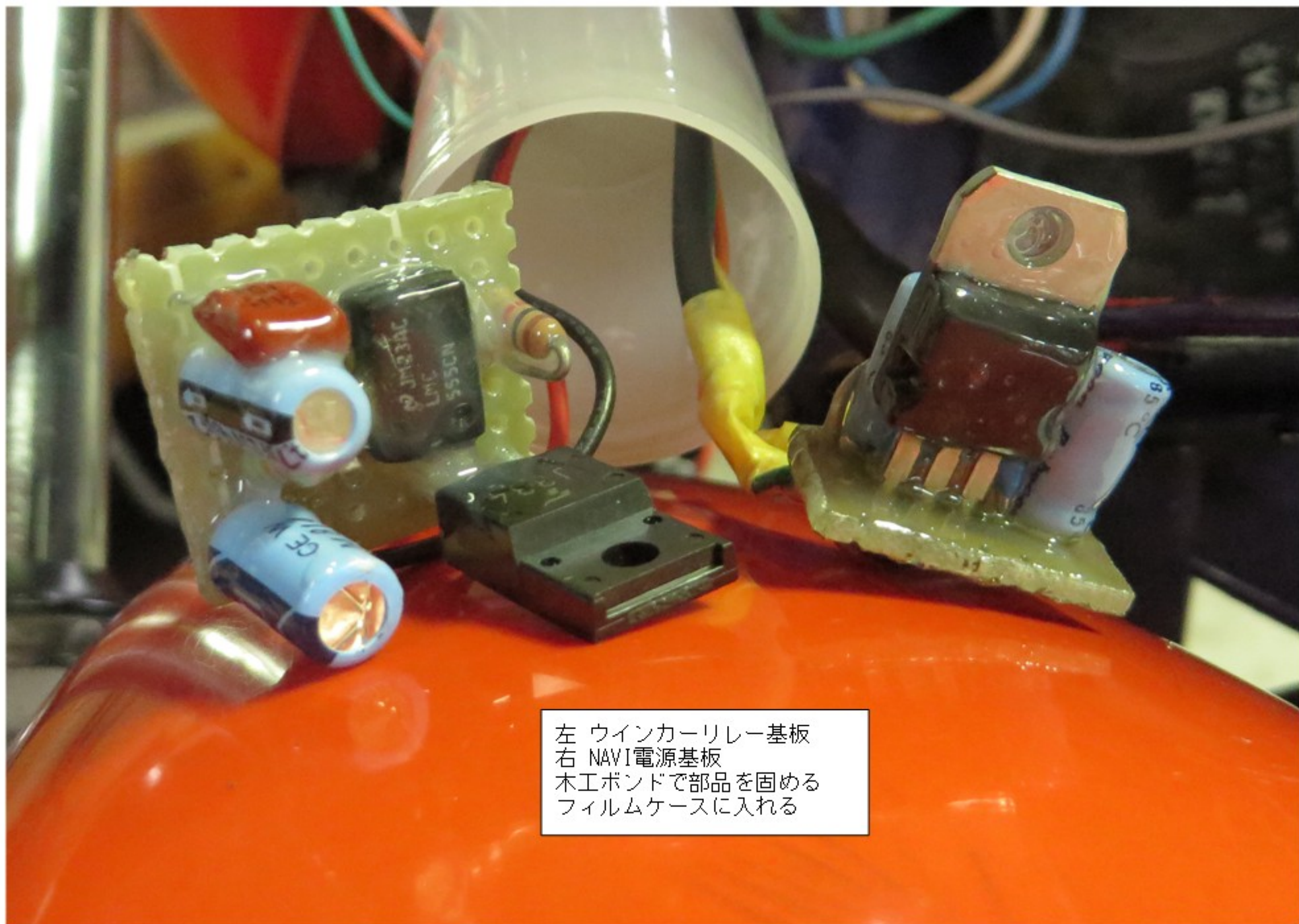
左 ウィンカーリレー基板 右 NAVI電源基板 木工ボンドで部品を固める フィルムケースに入れる